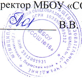
График питания обучающихся филиала МБОУ «СОШ № 16»